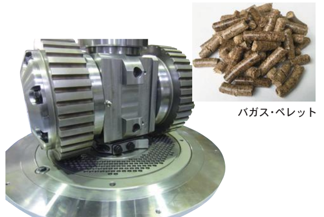
バガス・ペレット