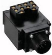
マスターシリンダ model SWRZ0H0-M